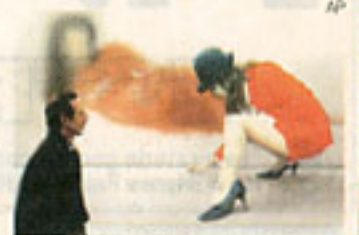
SENSUAL. Pintura del artista brasileño Luis Coquerano.

*** Desde los cuatro millones de dólares que cuesta una pintura de Joan Miró hasta los varios cientos por los que se pueden adquirir obras de artistas jóvenes. Todo esto ofrece ARCO, la feria de Arte Contemporáneo de Madrid que abre hoy sus puertas al público. 278 galerías de todo el orbe están presentes en esta vigésimo tercera edición, ofreciendo una variada selección de lo más actual en escultura, pintura, fotografía, grabado, vídeo, instalaciones y arte electrónico. Hasta el día 16 de febrero, estarán presentes 211 expositores europeos, 29 latinoamericanos y 28 nortea-