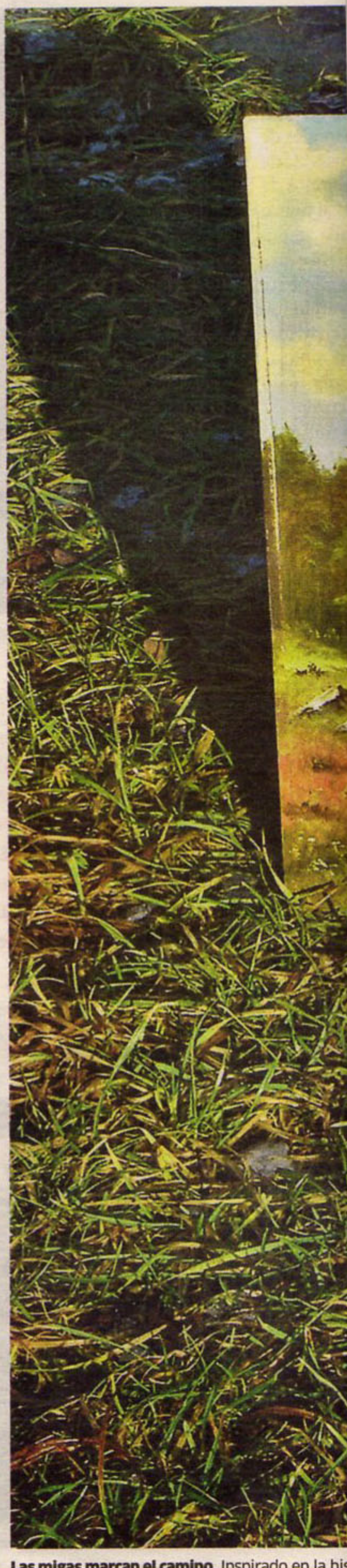
Las migas marcan el camino. Inspirado en la historia...