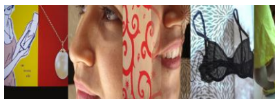
Gráfico n° 6: Nada que decir (2008)

particular uso del castellano que hacen los inmigrantes procedentes de América Latina son dos de los rasgos que más caracterizan a las personas procedentes de estas latitudes. Ejemplo de ello son las siguientes palabras extraídas de la obra (Ideas Felices, 2008): “La parada de la guagua estaba muy llena, pasaron tres camellos y no pararon y, como nadie me dio botella, terminé alquilando un carro que, por cierto, se pochó”. Las hermanas Prado (2008) señalan en el catálogo de la exposición Cuando crucemos el océano. 14 visiones sobre la mujer latinoamericana y caribeña en España (donde se visionó esta obra por primera vez), que su trabajo quiere incidir, y en ello coinciden con Cecilia Noriega-Bozovich, en cómo hablar un mismo idioma no implica que se produzca un entendimiento entre inmigrantes y nativos, o incluso entre los primeros entre sí. De manera que lo que en un principio pudiera verse con un punto de unión, acaba transformándose en un punto de desencuentro, en un obstáculo para la comunicación y los procesos que conducen a la interculturalidad y la hibridación, a no ser que exista voluntad para propiciar el entendimiento por parte de todas las comunidades que conviven en un mismo lugar y comparten el mismo idioma, en este caso el castellano.