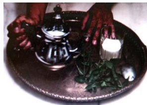
Gráfico n° 2: Memoria In-between (2007)