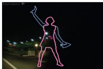
Gráfico n° 7: N340-Globalfem (2006)

en off que ofrece información social, política y económica relacionada con la N-340 y las personas que la transitan. Dentro de éstas últimas también se encuentran escenas que se corresponden con entrevistas a trabajadoras sexuales ubicadas a lo largo de esta carretera. Estos dos tipos de imágenes, las rápidas y las lentas, remiten al espectador a los dos tiempos que comparten rivalidad en la sociedad española contemporánea: el tiempo rápido del capitalismo globalizado y el pausado del inmigrante. A lo largo de todo el vídeo ambas temporalidades se muestran confrontadas, intentando no ceder ante las presiones de la oponente. Se trata, por tanto, del “tiempo de colisión” formulado por Hernández-Navarro, que las artistas también han pensado como única posibilidad para alterar el orden social, político y económico actual en España, y abrir nuevas vías de acción que tengan en consideración a los inmigrantes asentados en este país y, en especial, a las mujeres.