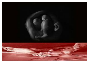
Gráfico nº 4: Aracné (2007)